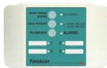
TASMAN 4 existe en TASMAN 2